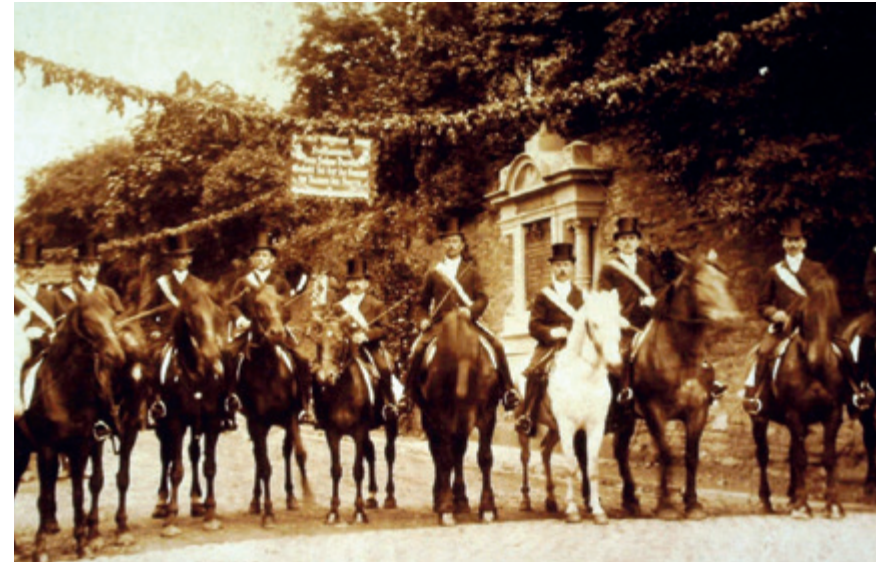
Aufstellung des Reitercorps auf der Kirchstraße, 1908

Besonders in Erinnerung geblieben ist die am 19. August 1947 ab Haus Morp eskortierte, feierliche Einholung der am 17. Juni 1942 zu Kriegszwecken demontierten Erkrather Glocken, die nach Wiederauffin-