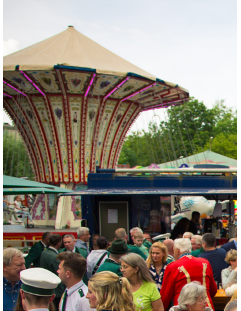
Kettenkarussell bei Erkrather Schützenfest

Wir wünschen Ihnen – vor allem Ihren Kindern - viel Spaß und Freude !