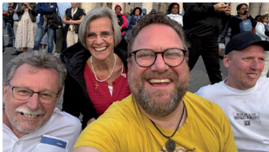
Eine kleine Gruppe der Pilger auf dem Petersplatz, Foto: Tobias Wienke

gestrigen Erlebnis fühlte sich das Durchschreiten der dritten heiligen Pforte nochmal anders an. Es ist schwer zu beschreiben, aber dieses Erlebnis hat bei Allen großen Eindruck hinterlassen. Zu guter Letzt ging es noch in die Kirche Santa Maria Maggiore – die erklärte Lieblingskirche von Papst Franziskus, in der auch seine sterblichen Überreste beigesetzt wurden. Sein Grab – eine schlichte, weiße Platte mit einem kleinen silbernen Kreuz – zeigte erneut, was diesen Papst ausgemacht hat.