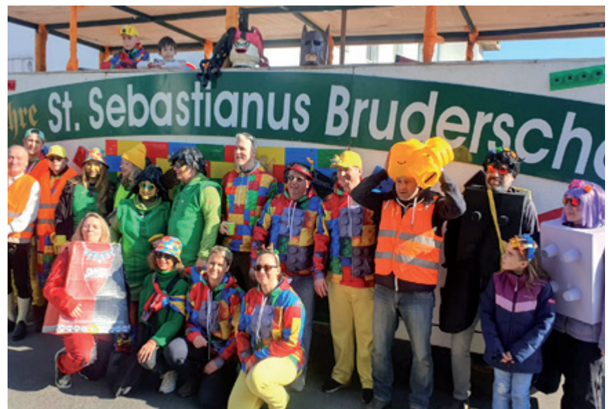
Die Truppe der Sebastianer vor ihrem Wagen beim Unterbacher Karnevalszug

Alle hatten viel Spaß bei den gut besuchten Veranstaltungen. Das alles wurde aber nur möglich, weil eine Gruppe aktiver Männer und Frauen den Wagen vorbereitete und den Umzug organisierte.