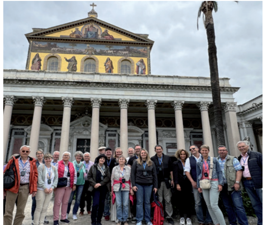
Pilgergruppe der Bruderschaft vor der Kirche „St. Paul vor den Mauern“, Foto Maik Wellens

Nach einer kurzen Stärkung ging es dann in den Untergrund zu den Katakomben von Santa Domitilla. In diesem größten Katakomben System Roms aus den ersten vier Jahrhunderten nach Christi Geburt fühlt man sich ein wenig wie Indiana Jones. Allerdings sind in solchen Katakomben keine Skelette zu finden, dafür zahlreiche antike Fresken und Gedenken an den frühchristlichen Optimismus. „Und wir wissen, dass für die, die Gott lieben und nach seinem Willen zu ihm gehören, alles zum Guten zusammenwirkt.“, schrieb Paulus in seinem Brief an die Römer. Mit diesem Glauben bestatteten die frühen Christen ihre Toten in eben solchen Katakomben. Den Abend verbrachten wir in