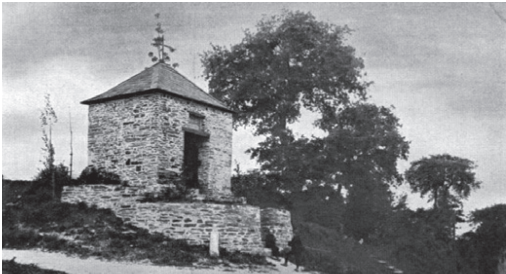
Historisches Foto vom Heilighäuschen um 1900/1910

Spendenquittungen können bei Bedarf ausgestellt werden. Rückfragen bitte unter: vorstand@bruderschaft-erkath.de