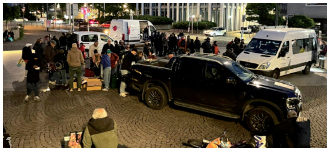
Essens- und Kleiderausgabe in Düsseldorf mit Mitgliedern der Bruderschaft, 28.05.2025