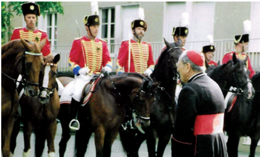
Joachim Kardinal Meissner begrüßt das Reitercorps