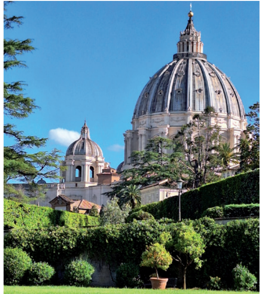
Blick auf den Petersdom aus den Vatikanischen Gärten heraus

Am letzten Tag standen noch weitere Kirchenbesuche auf der Agenda. Die Lateranbasilika beeindruckte mit ihren riesigen Heiligenstatuen und nach dem