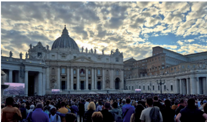
Warten auf den Rauch, Petersplatz

Am nächsten Tag folgten wir dem Pilgerweg von der Engelsburg zum Petersdom. Hier durchschritten wir die zweite heilige Pforte und wurden dann vom Inneren des Doms in den Bann gezogen. Die Fülle an Mosaiken, Statuen und Kirchenfenstern war kaum zu fassen. Auch der Besuch der vatikanischen Grotten mit den Papstgräbern, unter anderem von Benedikt XVI., hinterließ bleibende Erinnerungen.